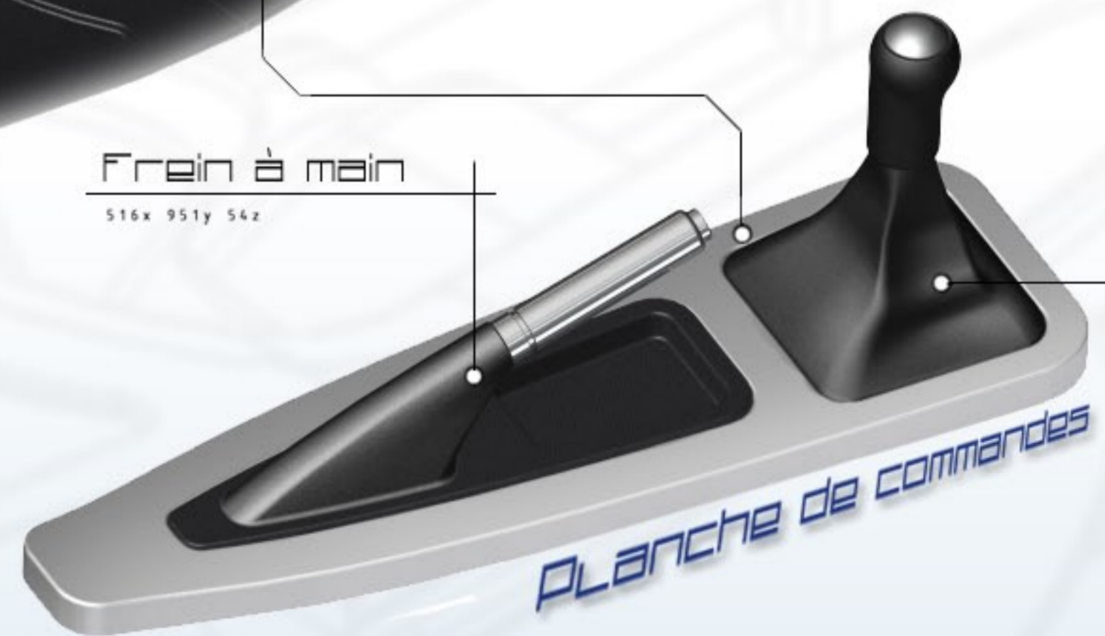
PLANCHE DE COMMANDES